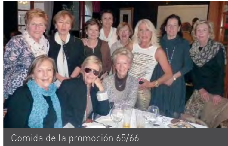
Comida de la promoción 65/66

Un año más, y ya son... ¡da igual! Gracias por tantos años de vivencias y valores que nos han marcado. Gracias por tantas personas que han sembrado el bien en nuestra educación. Nos hemos vuelto a reunir nuestra promoción en la ya tradicional comida de principio de curso. De nuevo, tiempo para recordar, compartir y como siempre, pasar un buen rato. ¡Si parece que fue ayer! Nos volvimos a juntar para las Bodas de Plata y desde entonces no hemos fallado ni un solo año.