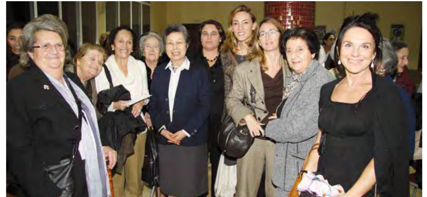
Foto de familia con la Junta