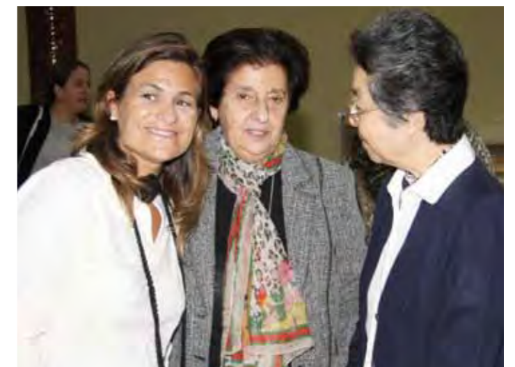
Momentos de la recepción en el colegio