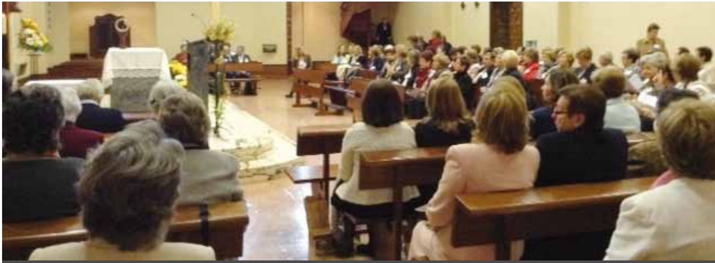
Eucaristía de la Asamblea Nacional