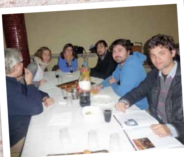
Día antiguo alumno 2013