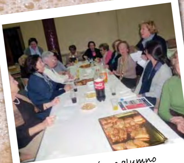
Día antiguo alumno 2013