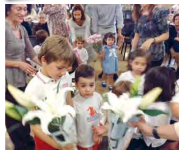
Fiesta fin de curso 2013