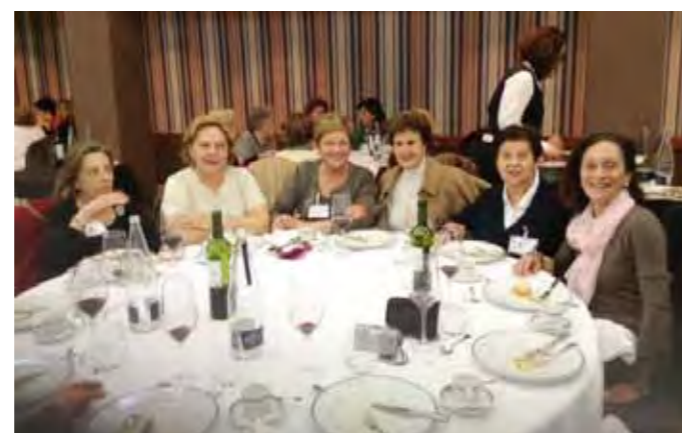
La representación de Valencia