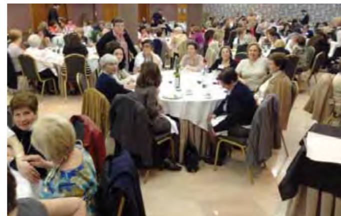
Comida que ofreció la Asociación de Santander

faela). Desde aquí os queremos animar a todos para que vengáis y que la Asociación de Valencia pueda ser representada por un gran número de asistentes, como siempre ha sido.