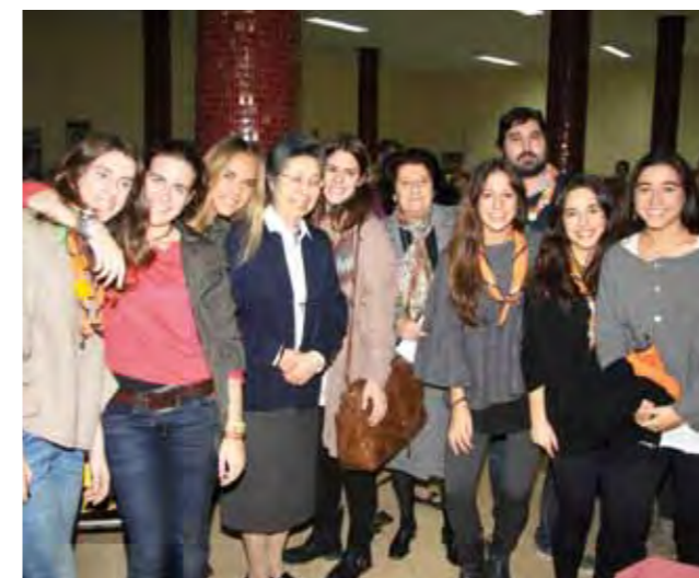
Foto de familia con Antiguos Alumnos