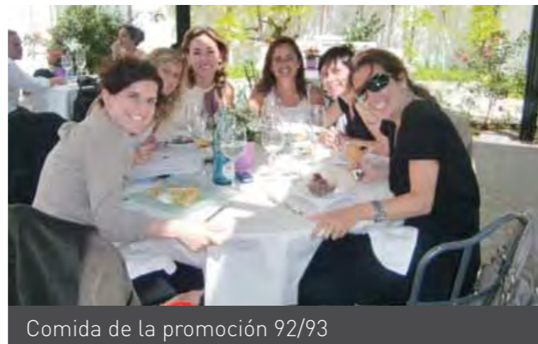
Comida de la promoción 92/93

Ánimo a todas y el año que viene, queremos más fotos!