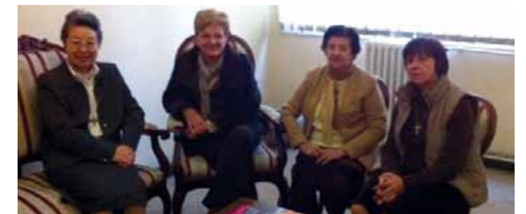
Recepción a la Madre General

Del mismo modo, en la reciente visita al colegio de las Esclavas de Valencia, fue recibida por toda la Junta de Antiguos Alumnos, dónde disfrutó de un rato animado de charla con todos los representantes de las diferentes Asociaciones y organizaciones de la escuela.