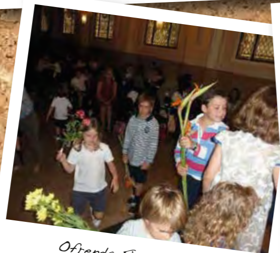
Ofrenda Fiesta Fin de Curso 2013/2014