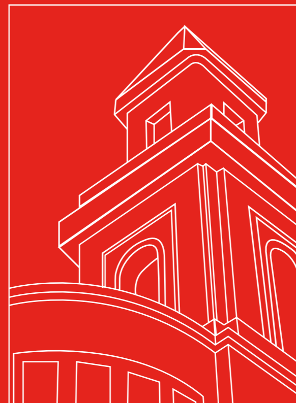
Recepción con la Madre General. Pág. 3