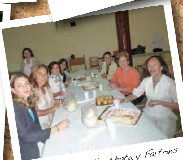
Merienda con Horchata y Fartons Fiesta Fin de Curso 2013/2014