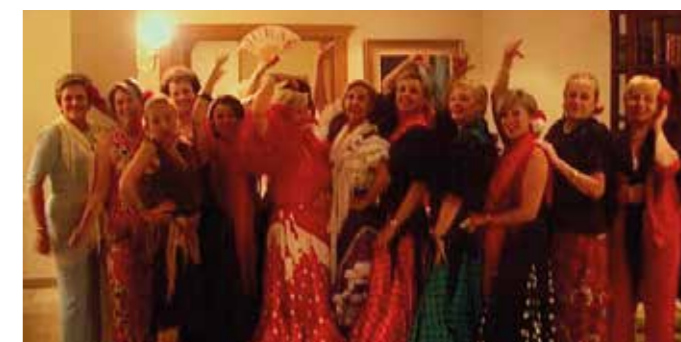
SOMOS AMIGAS. Amigas de verdad, que nos queremos y nos necesitamos.

Somos personas que no podemos vivir unas sin las otras, y ya no somos compañeras de curso ¿Sabéis que somos?