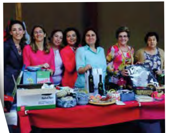
Rastrillo Multi-Fiesta del Colegio 2014